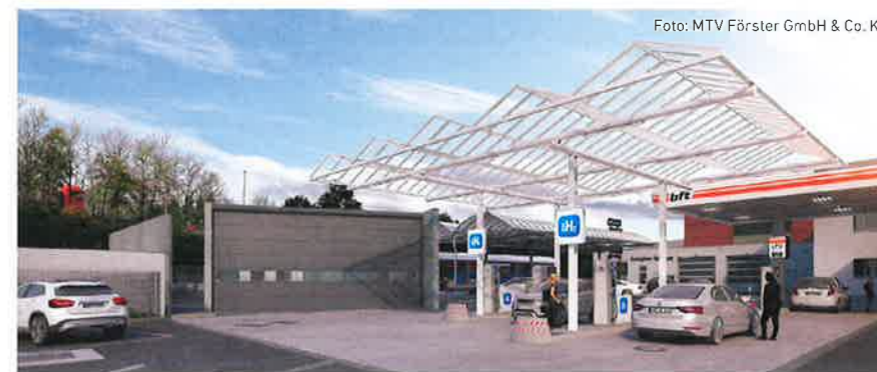
Visualisierung der Planung für die H 2 -Tankstelle der MTV Förster GmbH & Co. KG in Hanau.

den erzeugten Wasserstoff zu den Abnehmern zu bringen, da es am Standort kein ausgebautes Rohrleitungsnetz für Wasserstoff gibt. Als Übergangslösung können wir Gasflaschen selber mit grünem Wasserstoff befüllen und zum Abnehmer transportieren. Ziel ist es aber, kleine Elektrolysemodule anstelle der vorhandenen Gasflaschenständer einzubauen. Dann können wir ganz auf das Befüllen und Transportieren der schweren Flaschen verzichten. Die jeweils benötigten Mengen an Wasserstoff können vor Ort nachhaltig erzeugt und genutzt werden“, sagt der Projektleiter. Schottländer geht davon aus, dass noch in diesem Jahr eine Pilotanlage aufgebaut und im Industrialltag getestet werden kann.